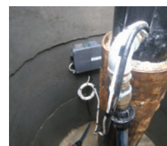
použití hladinového spínače ve studni