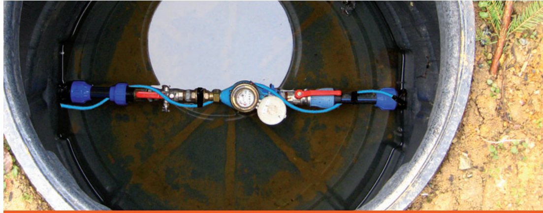
šachta na vodoměr na hlavním přívodu pitné vody pro RD

rodinné domy, rekreační objekty, drobné provozovny